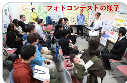
フォトコンテストの様子

今回から、時流に乗ってショート動画部門を新設しました。若い方からの応募が増えないかなという期待を持っていましたが、結果、写真部門も含め若い方からの応募が増えました。その状況が、審査結果にも反映された結果となりました。応募総数も昨年を上回り、審査員の間でも毎年このフォトコンテストが楽しみになってきたという声も頂きました。