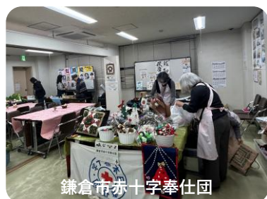
鎌倉市赤十字奉仕団

また手作り手芸品でバザーに出店された「鎌倉市赤十字奉仕団」からは、初めての出展でいい経験ができたと言われました。