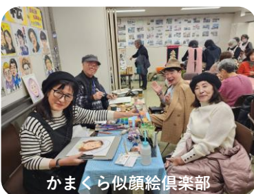
かまくら似顔絵倶楽部