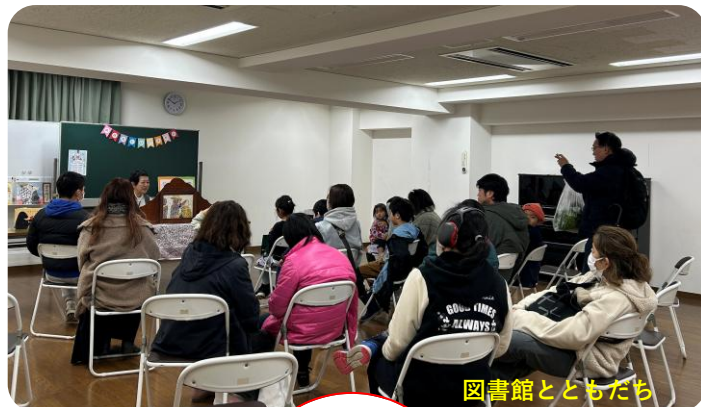
図書館とともだち

クリスマスにちなんで作ったクリスマスベルも個性豊か！音楽で想いを自由に表現され、どの方もキラキラ輝いていました。」と感想をいただきました。