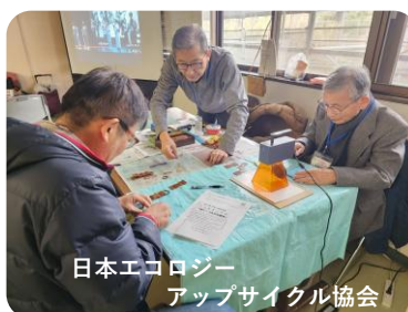
日本エコロジー アップサイクル協会