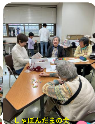
しゃぼんだまの会