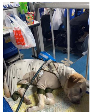
横浜スタジアム車椅子シート で過ごす盲導犬