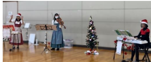
鎌倉武道館でのクリスマスコンサート

A: ほとんどの福祉施設では予算が非常に限られており、参加者の皆さんが使う楽器は私達音楽ファシリテーターが購入していました。コンサートをご希望でも、施設にピアノがない又は壊れていると個人での購入は厳しく、届けたいプログラムも組めず困っていたのと、参加者が増えた音楽ワークショップ用の楽器の補充もしたく思い切って申請しました。