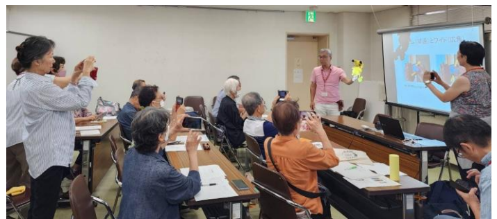
スマホで写真を撮ってみよう！NPOセンター大船

市内老人福祉センターでスマホ教室。 個人レッスン（スマホ、資料作成、Zoom、就活支援など）も実施中。