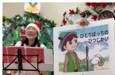
絵と音で楽しむ歌紙芝居