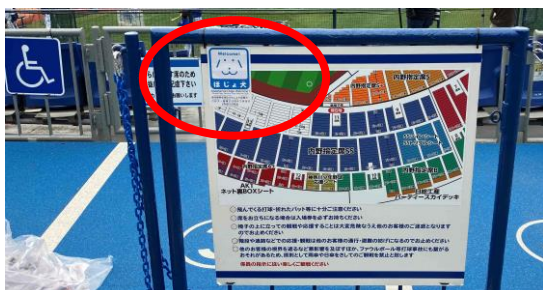
横浜スタジアム 内野車椅子シート