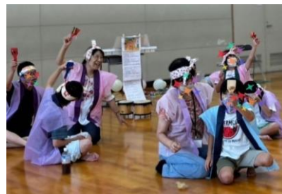
夏のイベント盆踊りシュピーレン

A: それぞれの楽器は福祉施設や鎌倉武道館で行ったクリスマスコンサート、定期的な音楽ワークショップシュピーレンの活動、季節の音楽イベント活動に活躍し、皆さんはじける笑顔で満喫されています！