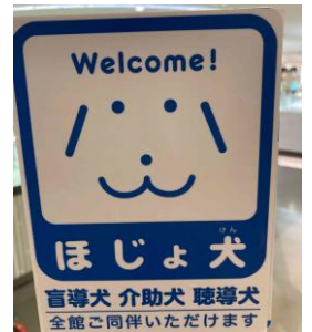
補助犬入店シート

現在、このような啓発活動にご理解のある補助犬ユーザーさんのボランティアを募集しています。一緒に活動してみませんか。