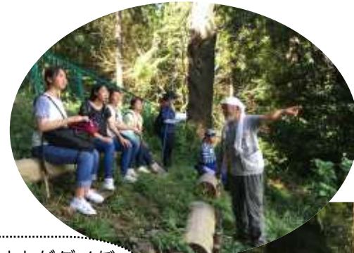
(明月荘わかたけの会)