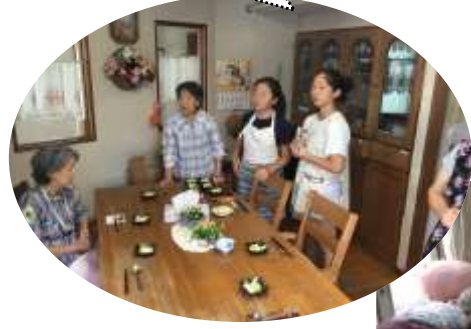
(グループホーム華花)

「自分が想像していた介護の現場よりも、明るい雰囲気でした」 「共同生活の大切さを知りました」