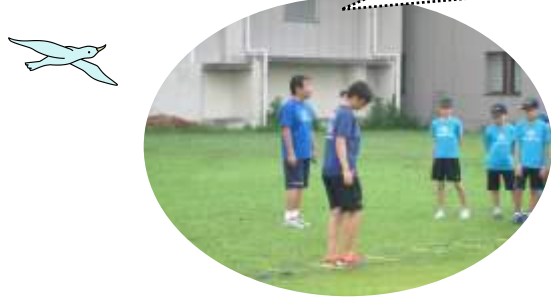
(鎌倉カルチャー&スポーツクラブ [Mi-Ku-To])

2日間にわたって、『御成ぼんぼり祭り』の子ども向けおもちゃ釣り(宝つり)に参加してもらいました。 暑い日でしたが、周囲に気を配って足りないところを探して自分からよく動いてくれていました。お客さまの子どもにも声をかけ、優しいお兄ちゃん、お姉ちゃんは人気でした。