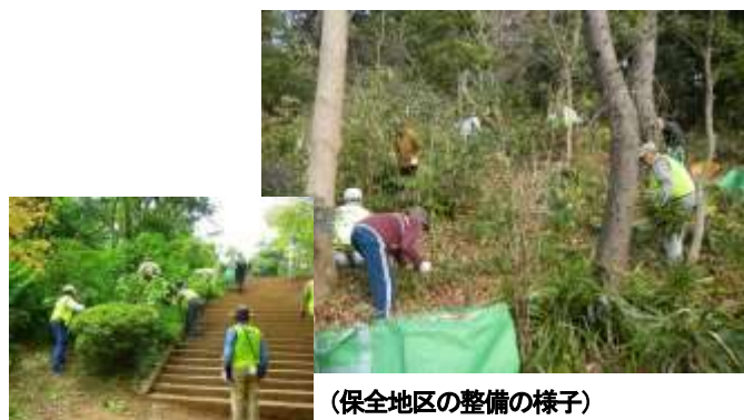
(保全地区の整備の様子)

活動日等の詳細は、 kamakura.midori@gmail.com にメールでお問い合わせください。