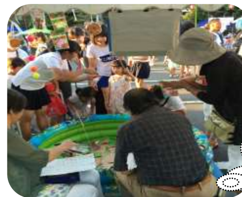
(鎌倉市市民活動センター運営会議)

動きも良く、てきぱきと、しっかり任務をこなされ、頼りになりました。 水泳協会のイベントでは、専門的な知識や経験が必要な係と、それをサポートする補助的な係があります。補助的な係ではどなたでも当日の簡単な説明で、お手伝いしていただけます。どのような体制や組織で運営されているのか経験することができますので、是非、参加していただきたいと思います。 初対面で、初めての場で、希望や質問や意見は言いづらいとは思いますが、遠慮せず発言していただくと、受け入れ側も非常に参考になります。