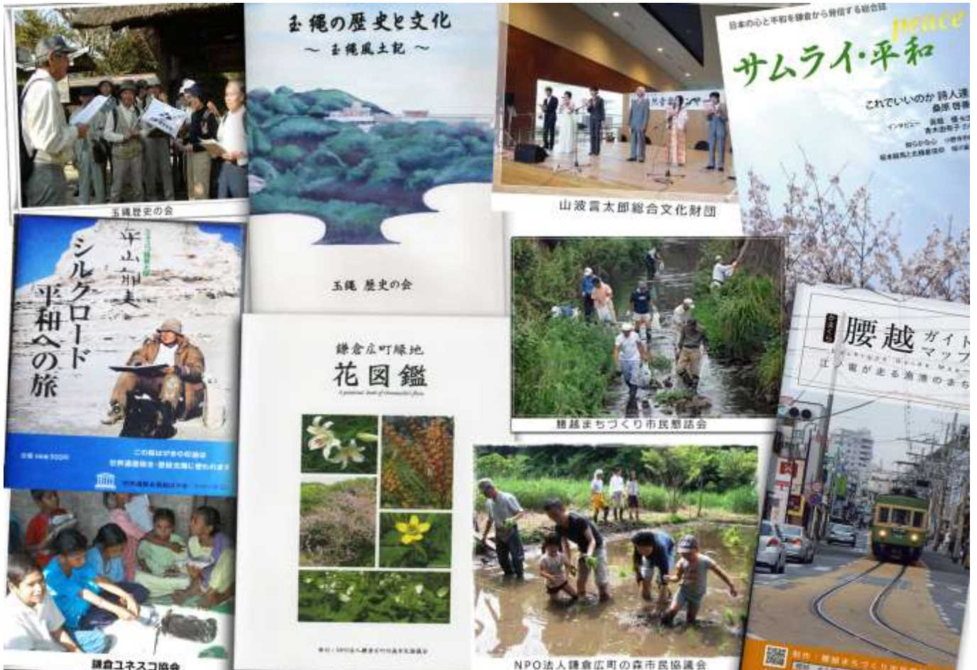
(受託販売している冊子やMAPと団体の活動の様子)